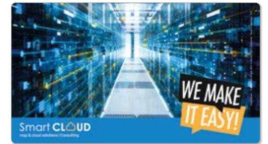
Ansicht des fertigen GripCleaner®

— = Druckfläche 286 x 166 mm inkl. 3 mm Beschnittzugabe