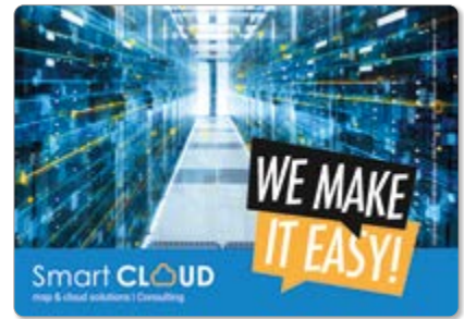
Ansicht des fertigen GripCleaner®

— = Druckfläche 216 x 156 mm inkl. 3 mm Beschnittzugabe