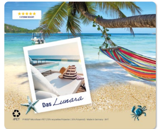
Ansicht des fertigen Displaytuchs