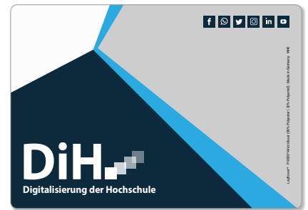
Ansicht des fertigen LapKoser®