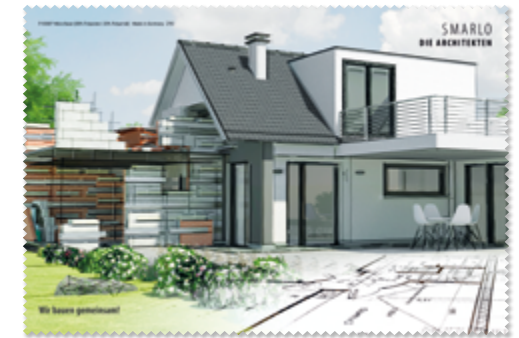
Ansicht des fertigen Brillentuchs

— = Druckfläche 306 x 206 mm inkl. 3 mm Beschnittzugabe