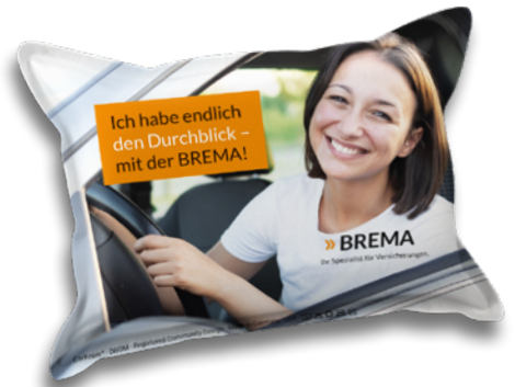
Ansicht des fertigen CarKoser®

• Wir empfehlen diese Angabe aufgrund der Textilkennzeichnungsverordnung.