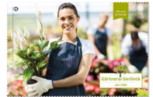
Ansicht des fertigen Brillentuchs