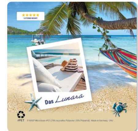
Ansicht des fertigen Displaytuchs