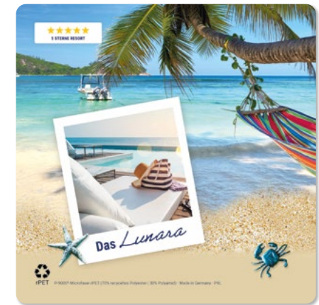
Ansicht des fertigen Displaytuchs