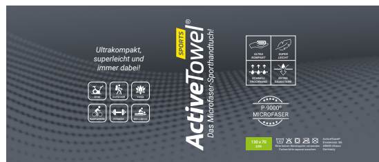
Ansicht der fertigen Banderole