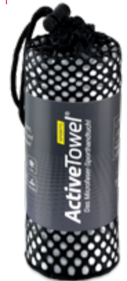
Ansicht im Netzbeutel

— = Druckfläche 251 x 106 mm inkl. 3 mm Beschnittzugabe