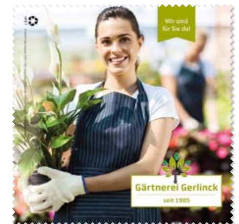
Ansicht des fertigen Brillentuchs