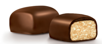
24 x Marzipan Minis Marzipan minis