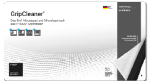
Ansicht der fertigen Einlegekarte