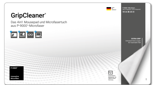
Ansicht der fertigen Einlegekarte