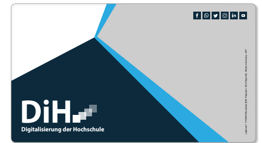
Ansicht des fertigen LapKoser®