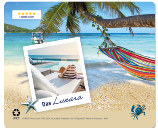
Ansicht des fertigen Displaytuchs