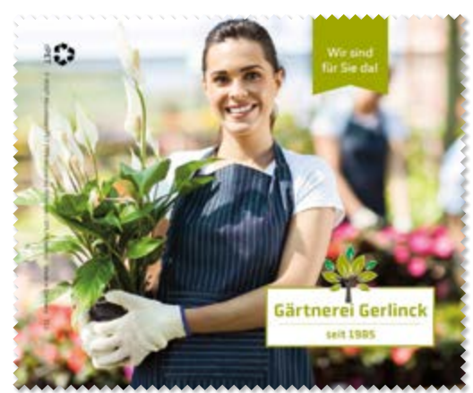
Ansicht des fertigen Brillentuchs