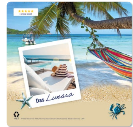
Ansicht des fertigen Displaytuchs