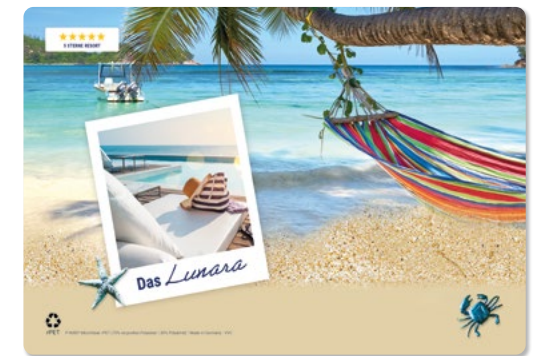
Ansicht des fertigen Displaytuchs

— = Druckfläche 310 x 210 mm inkl. 5 mm Beschnittzugabe