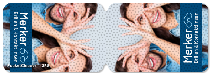
Ansicht des fertigen PocketCleaner® mit Simulation der Antirutsch-Beschichtung