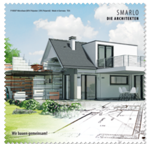
Ansicht des fertigen Brillentuchs