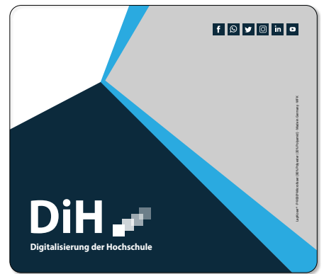
Ansicht des fertigen LapKoser®