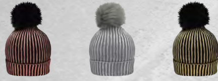
bronze/black silver/light-grey gold/black