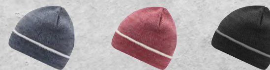
navy/white indian-red/white black/silver