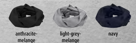
anthracite-melange light-grey-melange navy