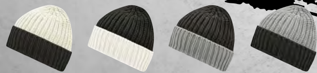
off-white/carbon carbon/off-white carbon/light-grey light-grey/carbon