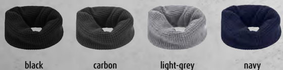
black carbon light-grey navy