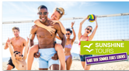
Ansicht des fertigen ActiveTowel ® Sports