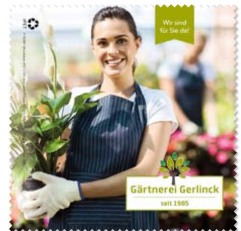
Ansicht des fertigen Brillentuchs

— = Druckfläche 190 x 190 mm inkl. 5 mm Beschnittzugabe